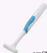
em(エム)オーラルリハ