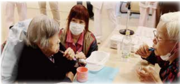
クッションなどを用い、姿勢を調整します。

口腔ケアの事前準備として、姿勢をきちんと整えること、口腔周囲の筋肉をマッサージし、揉みほぐすことで、格段に口腔ケアが実施しやすくなります。