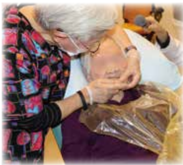
マッサージをすることで筋の緊張がほぐれ、唾液の分泌が促進されます。