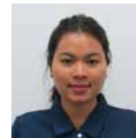
介護保険部 はるにれハウス ケアワーカー ピョー ス ナイン