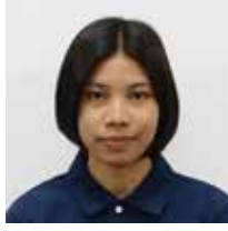
ノー エワー クさん