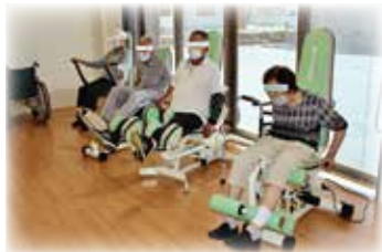
自主訓練(マシントレーニング)