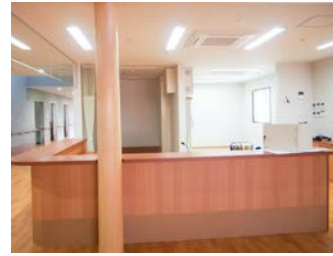
▶スタッフステーション オープンカウンターで周りを見渡せます。