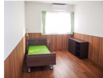
▶居室 電動ベッド・ローチェスト・エアコン・照明・テレビ回線・スタッフコールを完備しています。