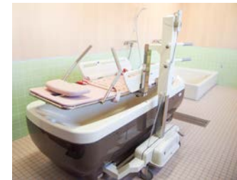
▶浴室 大浴槽と臥床した状態で入浴できるストレッチャー浴も設置しています。