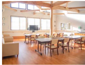
▶食堂・機能訓練室 吹き抜けの天井で明るい空間です。