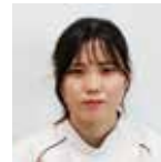
診療部 検査室 臨床検査技師