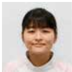
看護部 回復期リハビリテーション病棟 看護師