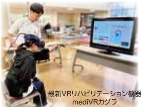
最新VRリハビリテーション機器 mediVRカグラ