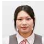
診療部 地域医療連携室 事務