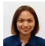
介護保険部 はるにれハウス ケアワーカー