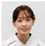
リハビリ部 言語聴覚士