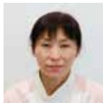
看護部 地域包括ケア病棟 看護師