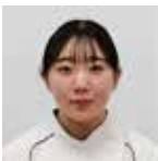
リハビリ部 理学療法士