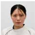
リハビリ部 理学療法士