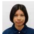
介護保険部 はるにれハウス ケアワーカー